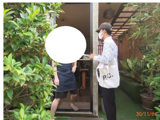
รูปที่ 3.5-3 กิจกรรมขณะดำเนินการสำรวจความคิดเห็นของพื้นที่ติดกับโครงการ และพื้นที่ในระยะ 100 เมตร จากขอบเขตพื้นที่โครงการ เมื่อวันที่ 26 และ 30 พฤศจิกายน 2566