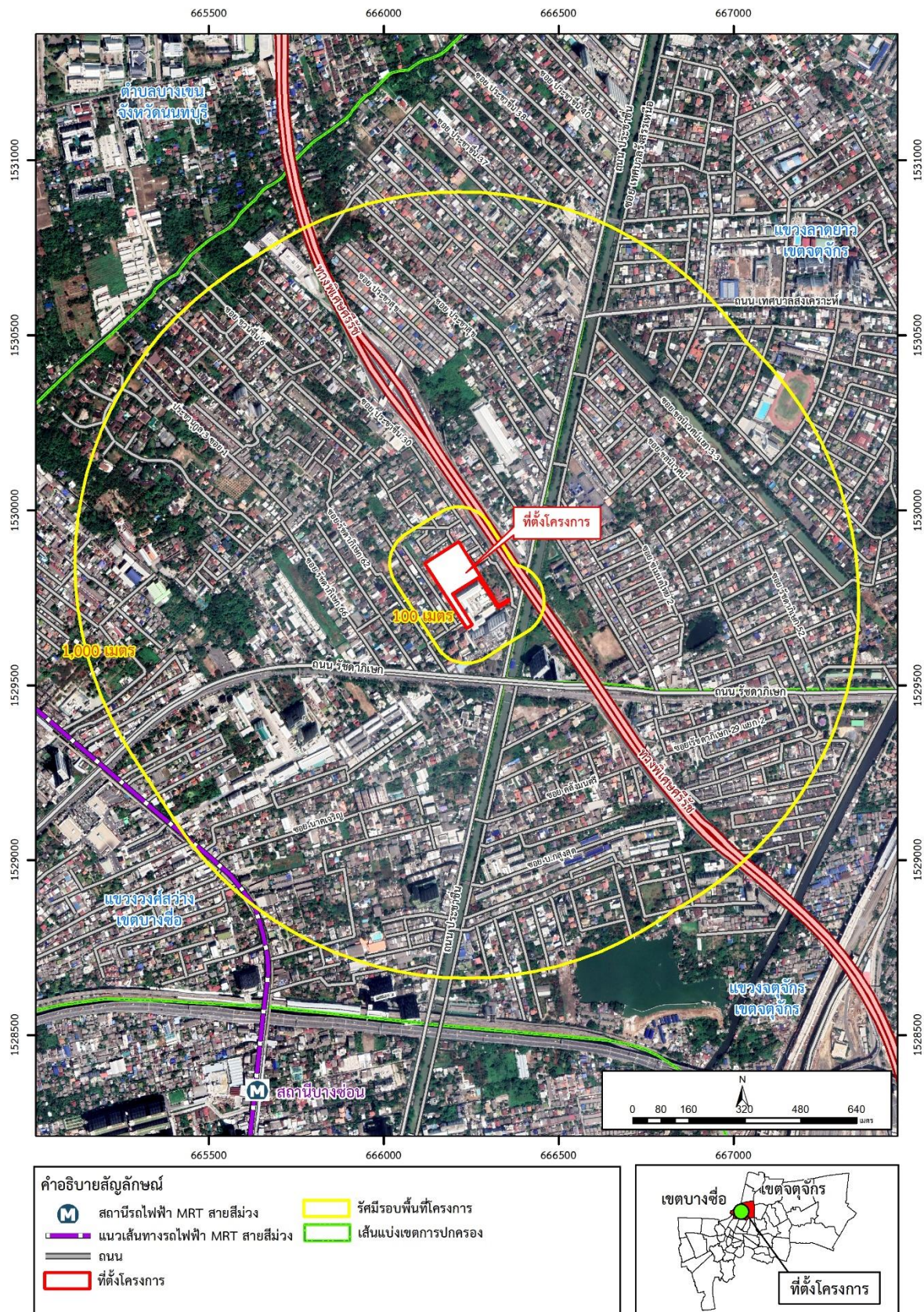
รูปที่ 3.3-1 พื้นที่สำรวจความคิดเห็นของโครงการ