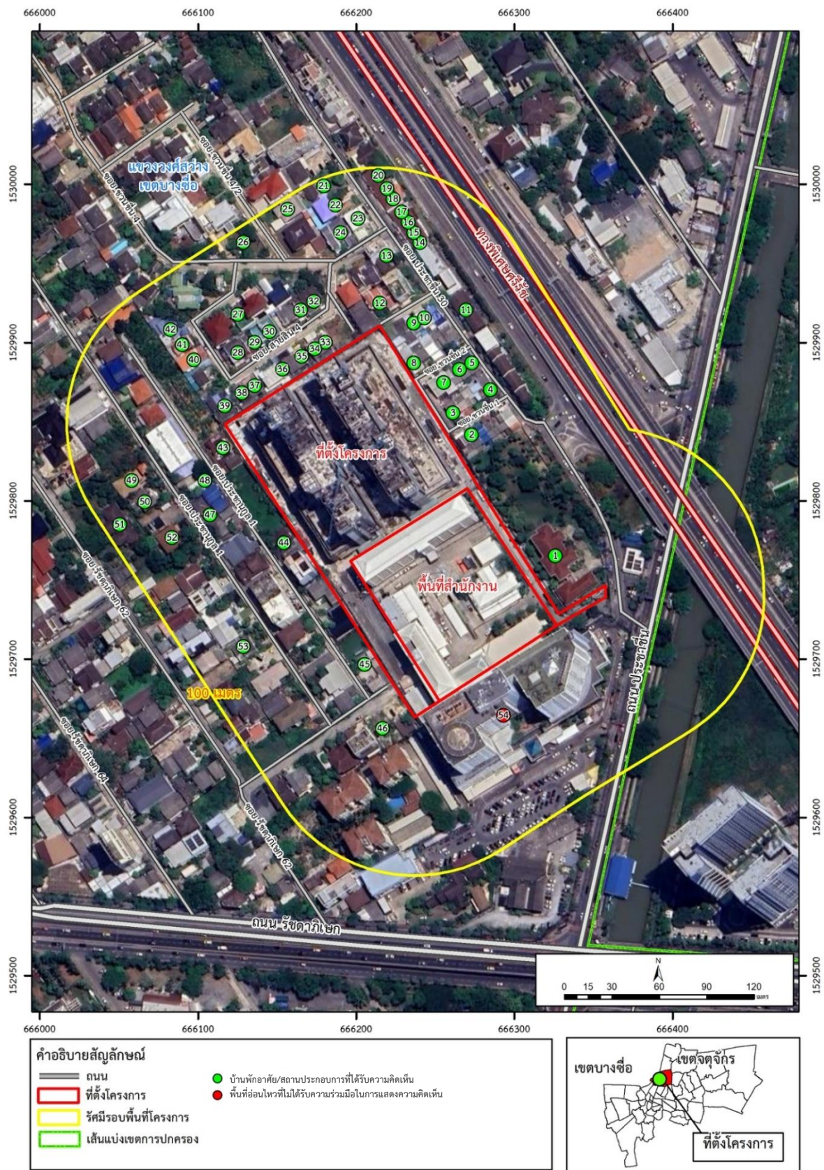
รูปที่ 3.5-1 ตำแหน่งสำรวจความคิดเห็นของพื้นที่ติดโครงการ และพื้นที่ในรัศมี 100 เมตรจากขอบเขตพื้นที่โครงการ